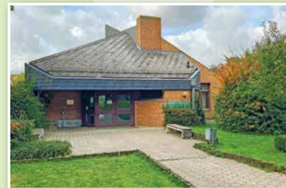
Gemeindehaus St. Nikolai-Kirche Burg auf Fehmarn, Breite Straße 47